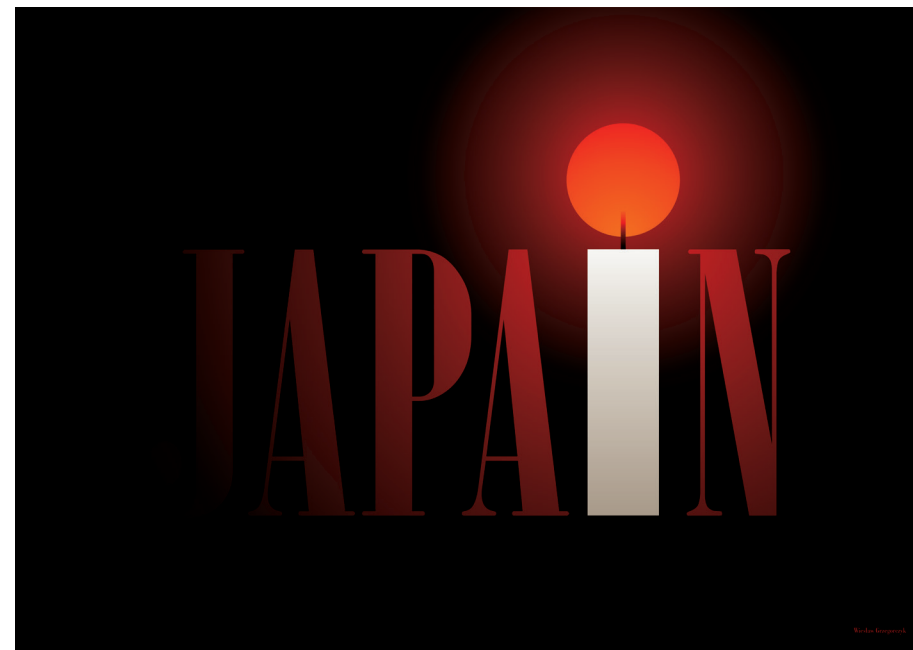
Japan. 2011, druk cyfrowy, 70 × 100 cm