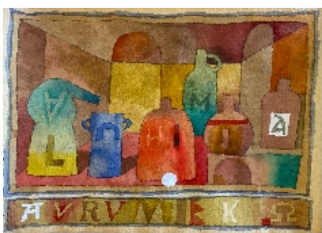
Prace na papierze