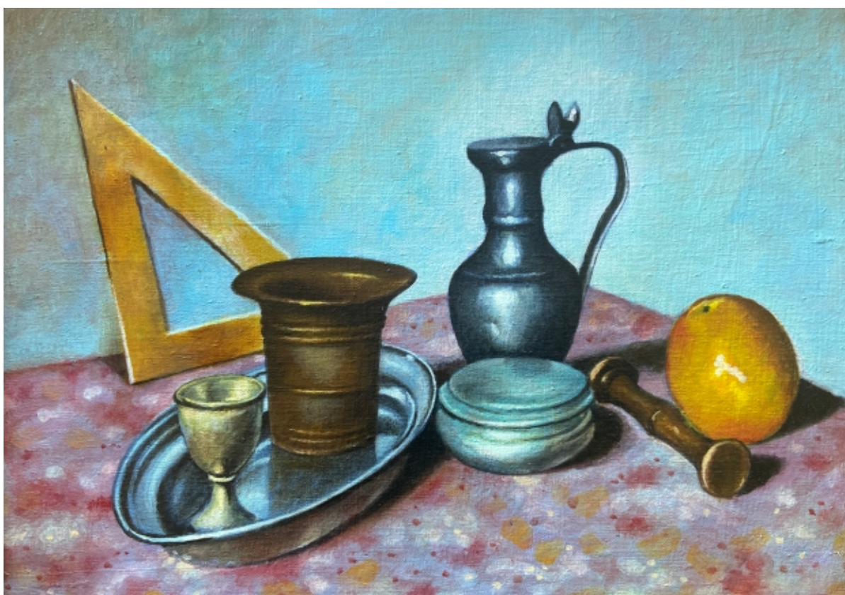
DEC 2009 DI 32 x 46 cm