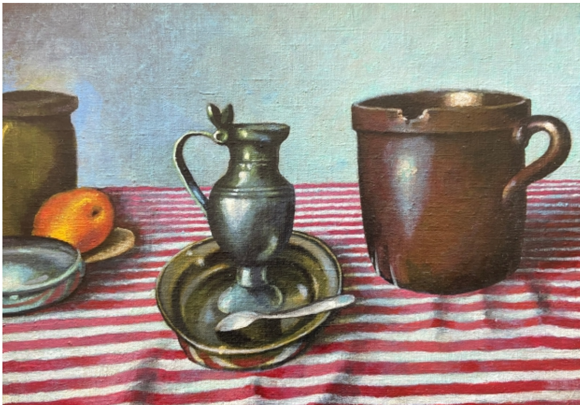
NOV 2009 AB 33 x 45 cm