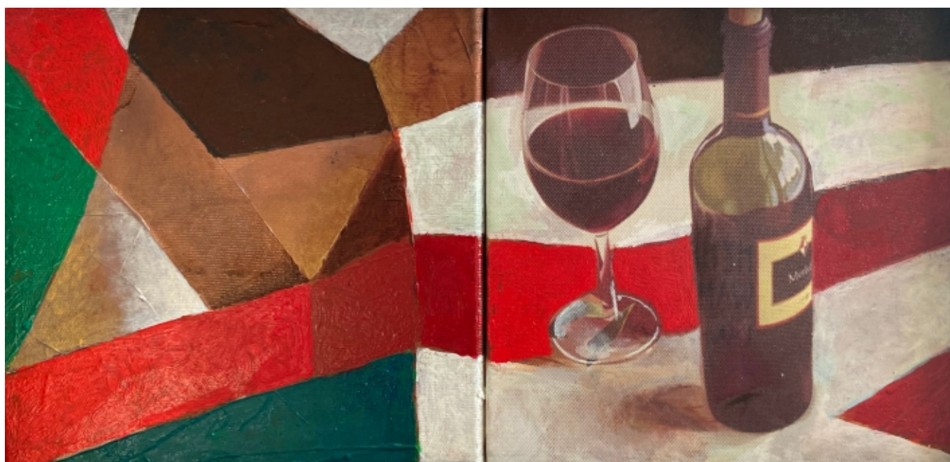
IAN 2020 DYPTYK