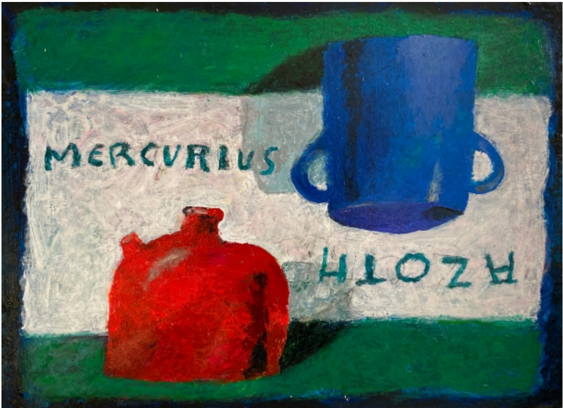
AVG 2020 27 x 36 cm