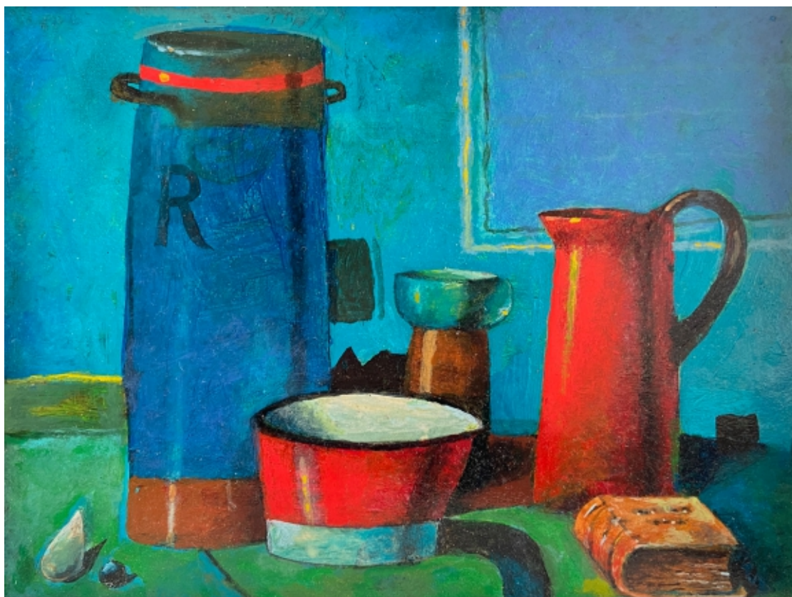
IVL 2017 25 x 33 cm