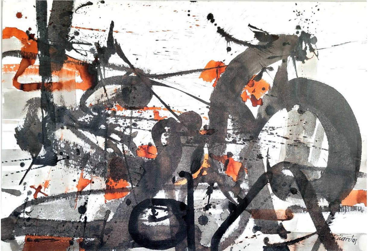
Szorstkie powierzchnie Nr. 47, 2024 tuszu, papier 62 x 87 cm